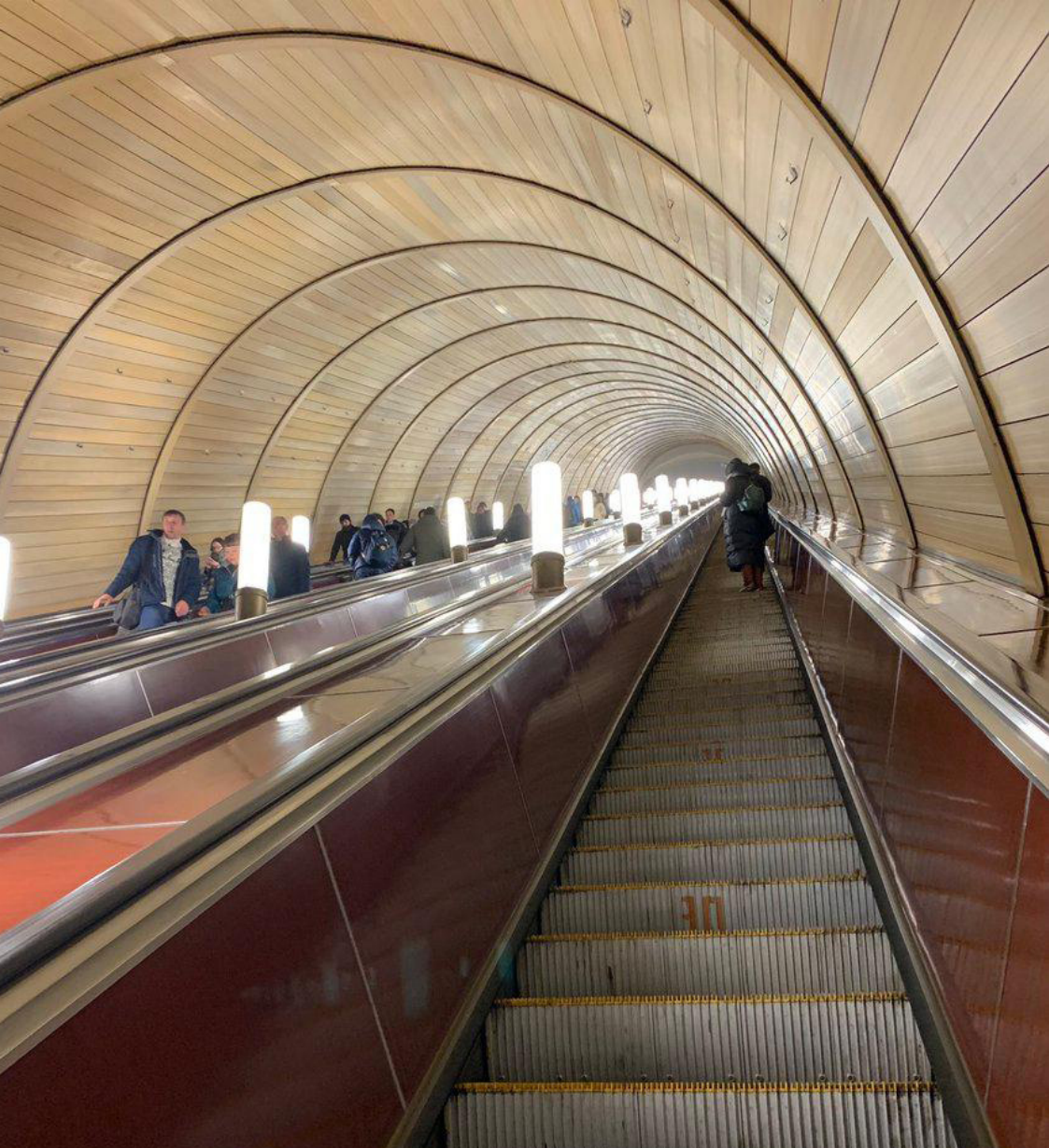
Мечта в 2014 году