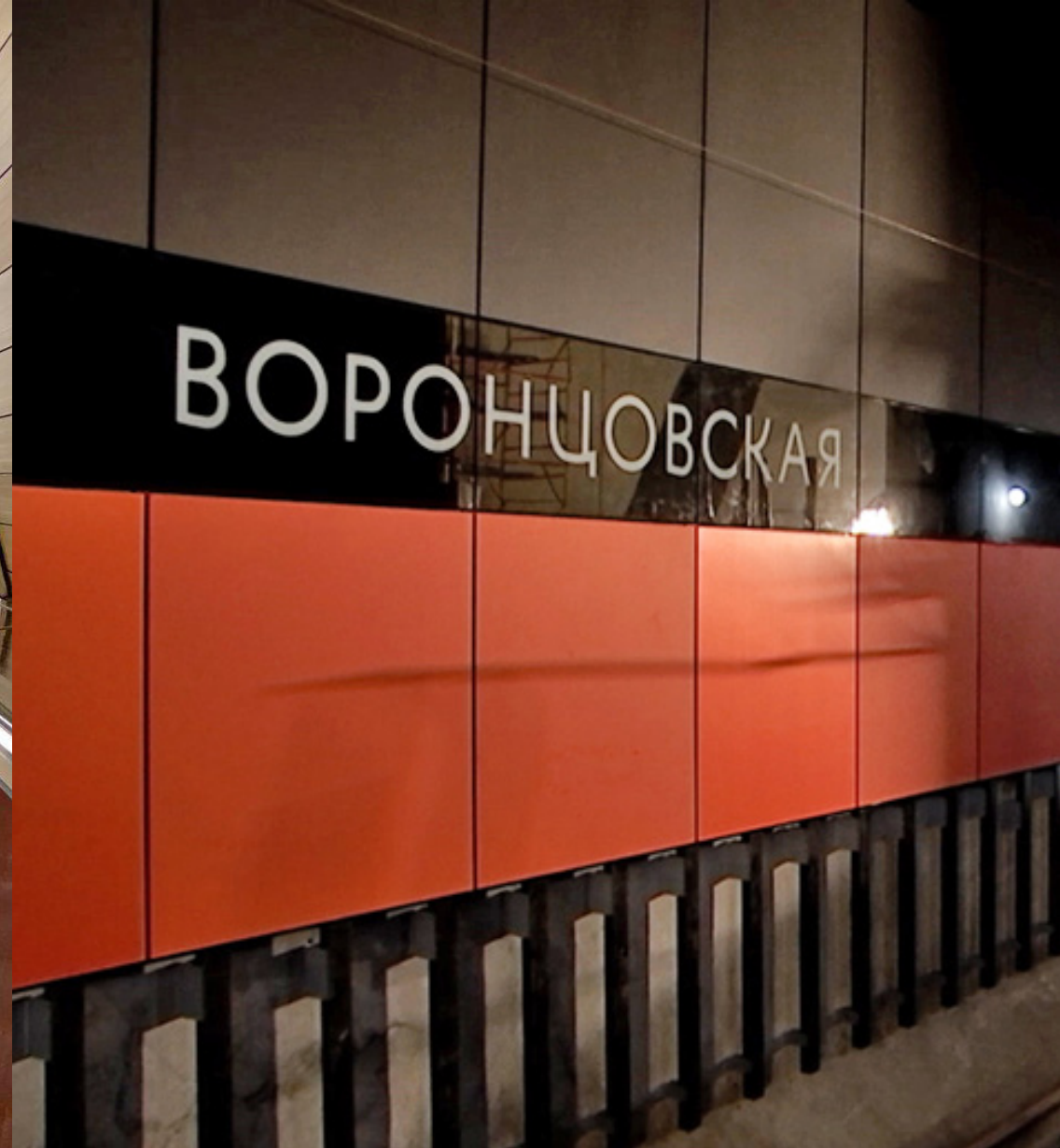
Реальность 2021 год