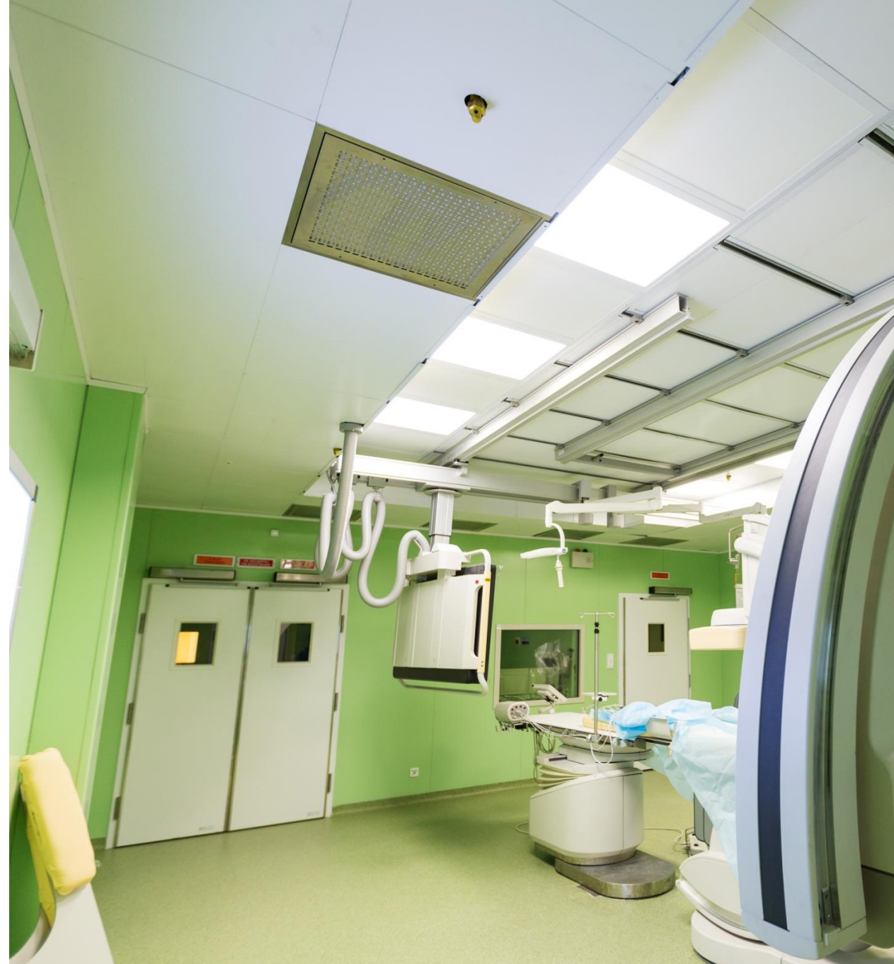
Александровская больница (оперблок), Санкт-Петербург