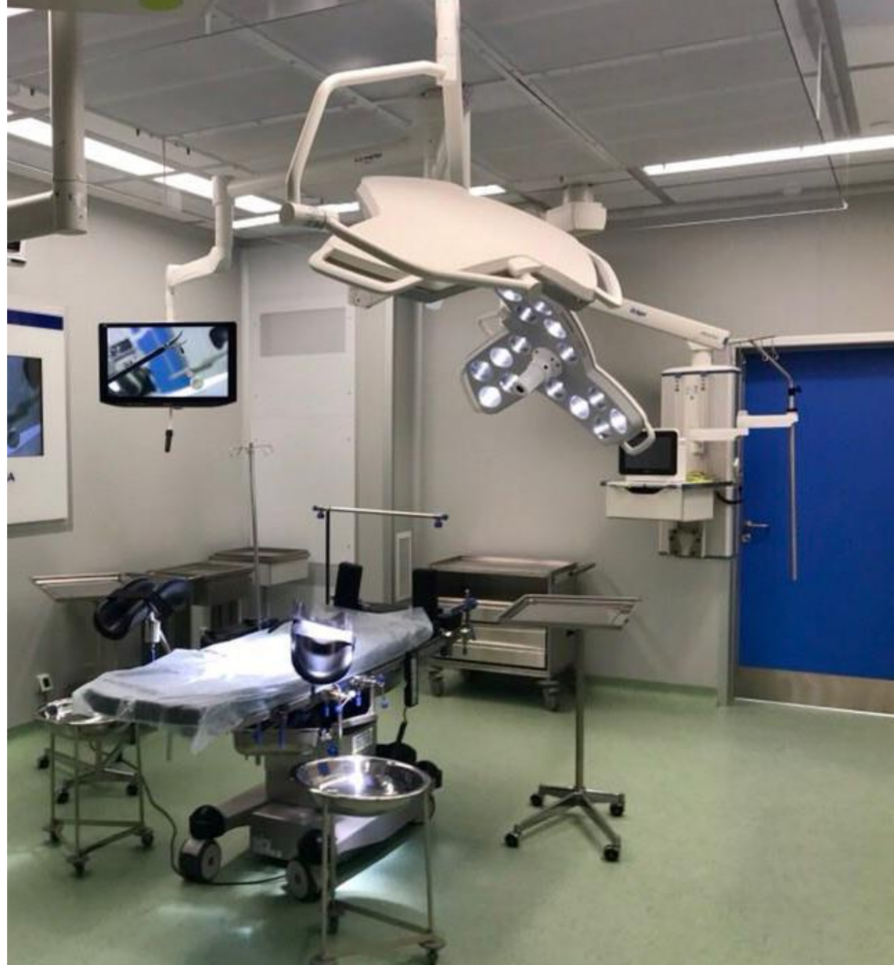
Клиника «Мать и дитя», Самара