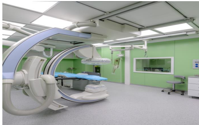
Система чистых помещений