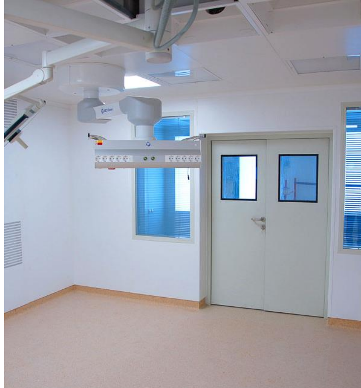
Республиканский онкологический клинический диспансер, Уфа