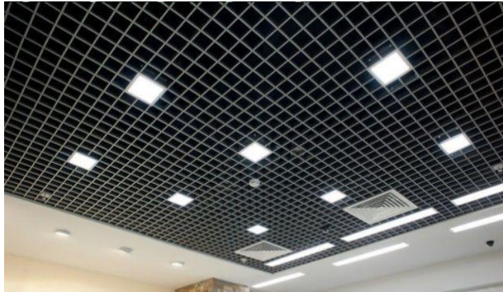
Растровый потолок Грильято