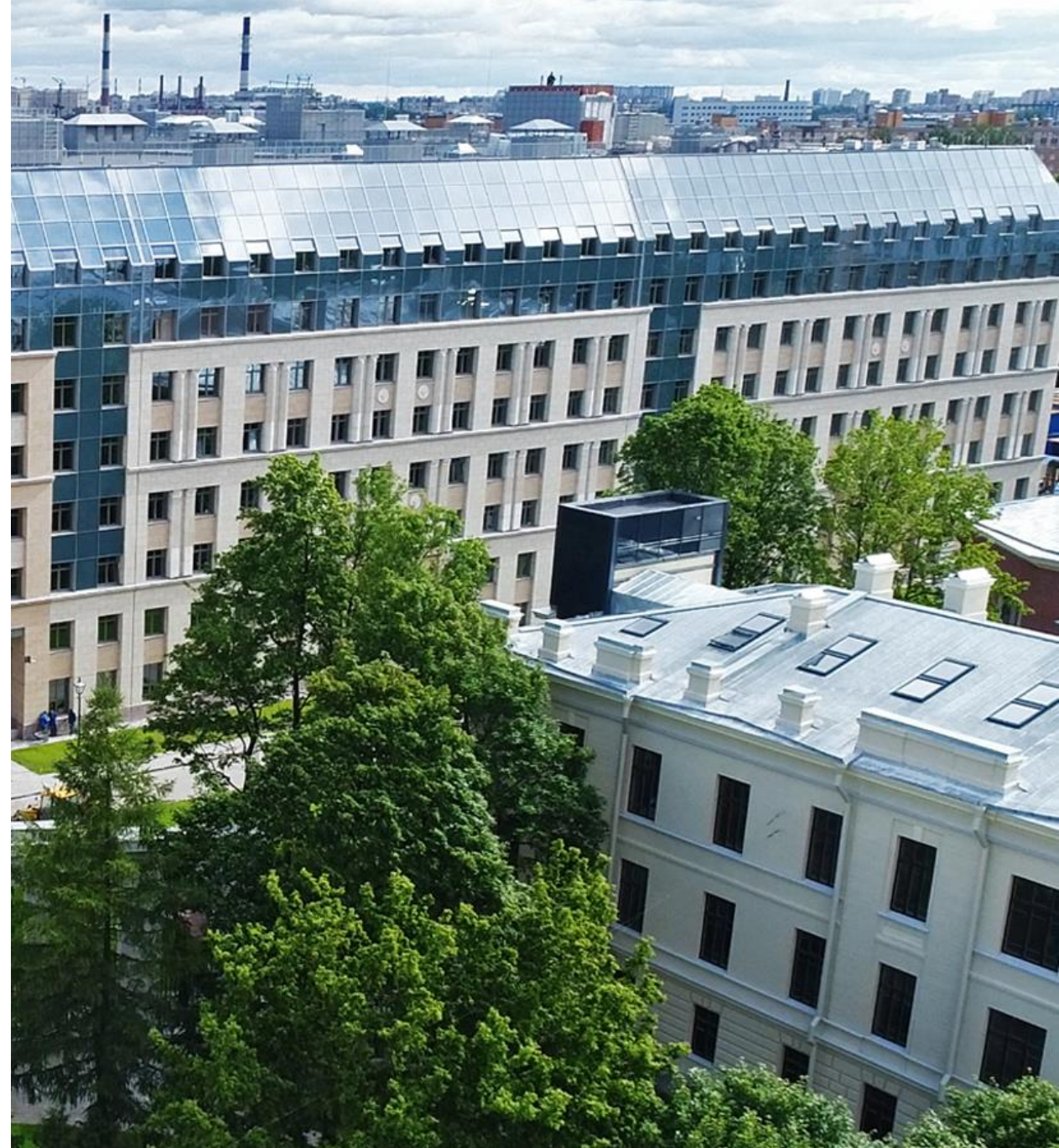
Многопрофильная клиника на территории в/г №60 Военно-медицинской Академии им. С.М.Кирова, Санкт-Петербург