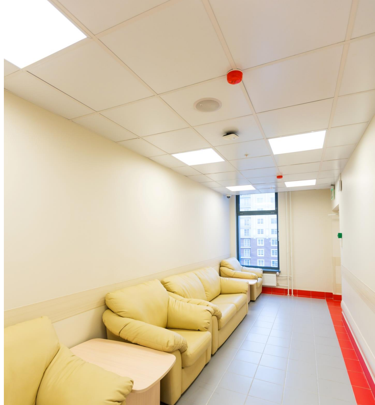
Морозовская Детская Городская Клиническая Больница, Москва